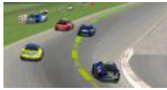
Die erster Kurve nach dem Start, der Champ SalaMichl war sofort wieder in Führung.

Somit wurde die "Ehre" der "maromi's" nur von LamRob verteidigt, das FireTeam bot jedenfalls wieder eine gute Vorstellung.