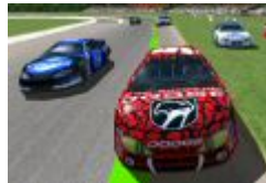
Unser Meister SalaMichl in Führung, links davon Meni, LamRob im "Acker"